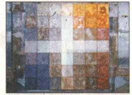
Aldás (2004, akril, vászon, 350x350 cm)